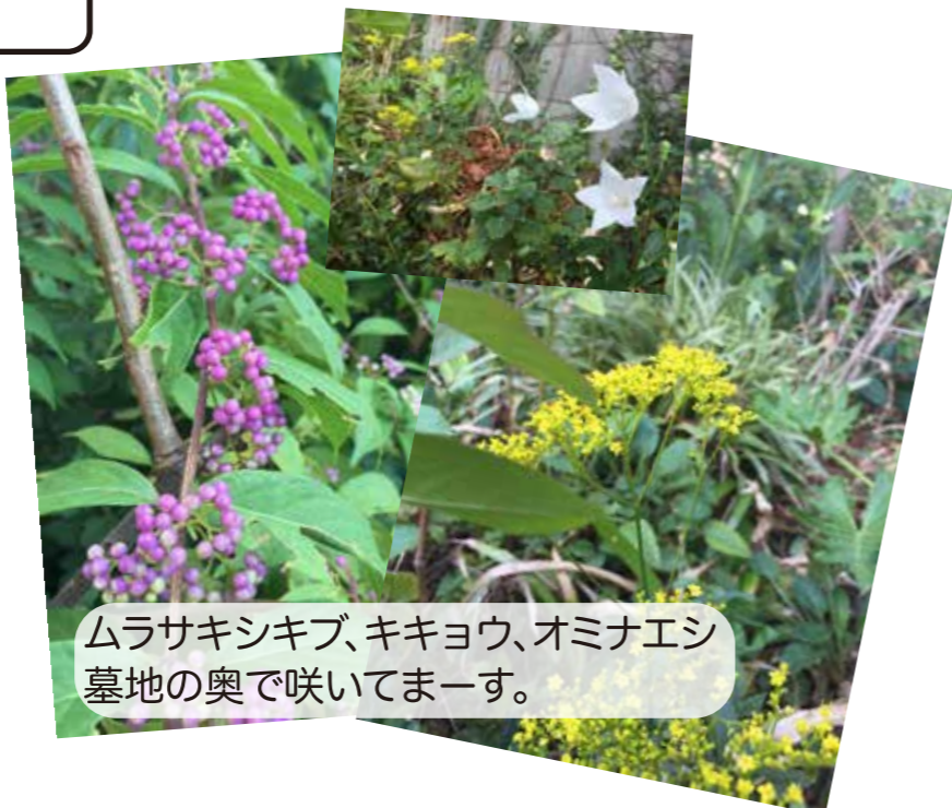
ムラサキシキブ、キキョウ、オミナエシ 墓地の奥で咲いてます。

現在の納入状況が不明の方は、お寺までお気軽にお問い合わせ下さい。すぐにお調べいたします。