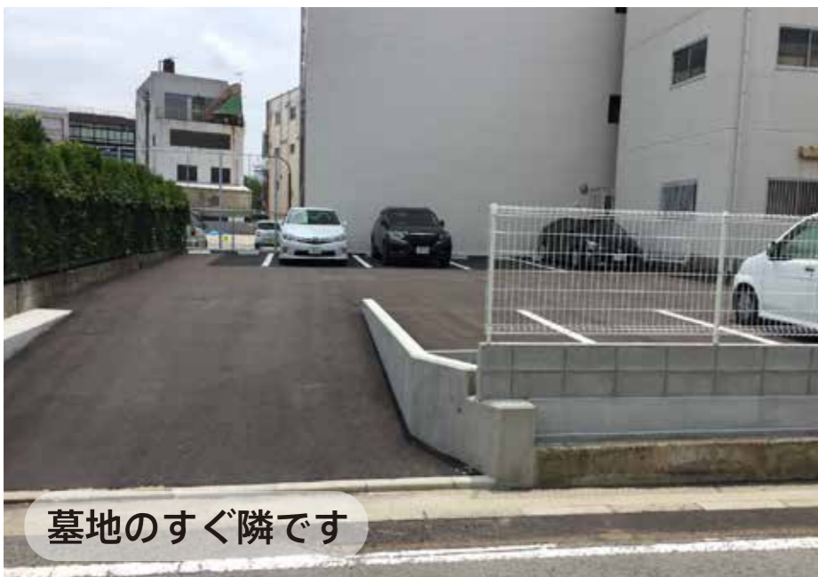
墓地のすぐ隣です

7月に墓地の西側の土地を取得しました。(地図参照)8台分のスペースがありますので、お墓参り時などぜひご利用ください。門の付近への路上駐車は、なるべくしないようお願いいたします。